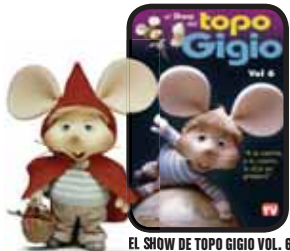
EL SHOW DE TOPO GIGIO VOL. 6